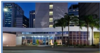
Hotel Ibis Budget Rebouças (São Paulo – SP)