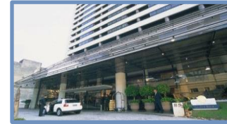
Golden Tulip Paulista Plaza (São Paulo – SP)