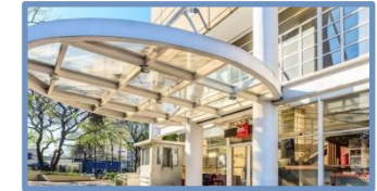
Ibis Guarulhos (Guarulhos – SP)