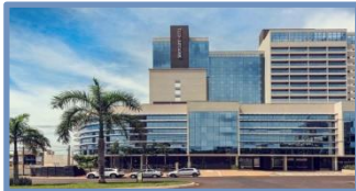
Ibis Style e Mercure Ribeirão Preto (Ribeirão Preto – SP)