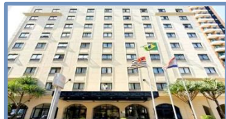
InterCity Premium Berrini (São Paulo – SP)