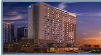
Ibis Budget Morumbi (São Paulo – SP)