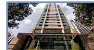
Blue Tree Premium Paulista (São Paulo – SP)