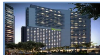
Ibis Styles Barra Funda (São Paulo – SP)