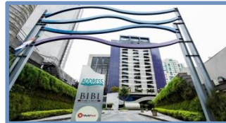
Address Faria Lima by Intercity (São Paulo – SP)