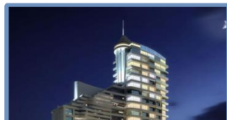
Veranda Berrini (São Paulo – SP)