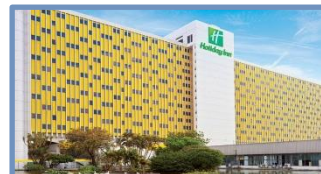
Holiday Inn Anhembi (São Paulo – SP)