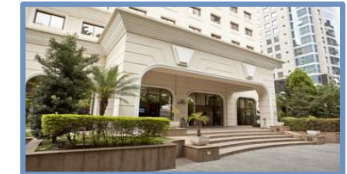
Quality Suites Long Stay Vila Olímpia (São Paulo – SP)