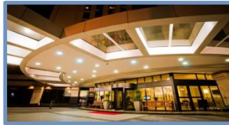
Nobile Suites Congonhas (São Paulo – SP)