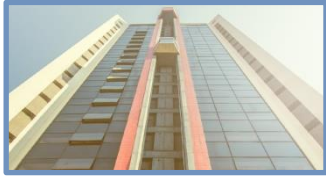
Golden Ingá Apart Hotel (Maringá – PR)