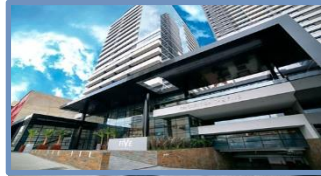
NH Curitiba The Five Hotel (Curitiba – PR)