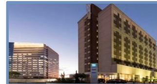
Ibis Budget Tamboré (Barueri – SP)