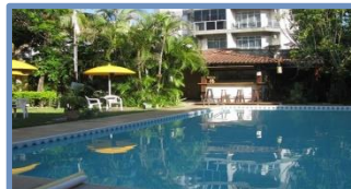
La Brise (Armação dos Búzios – RJ)