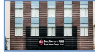
Best Western Copacabana Design Hotel (Rio de Janeiro – RJ)