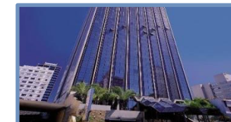
L'Hirondelle (Campinas – SP)