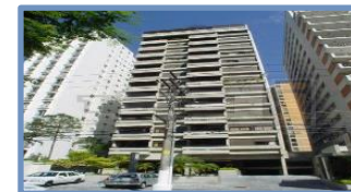
Flar Lorena 1157 (São Paulo – SP)