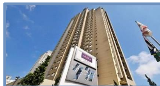
Mercure Vila Olimpia (São Paulo – SP)