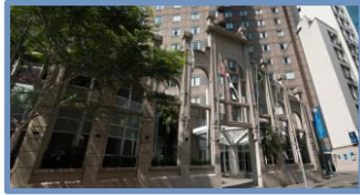
Nobile DownTown São Paulo (São Paulo – SP)