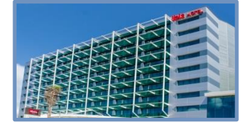
Ibis (Salvador – BA)