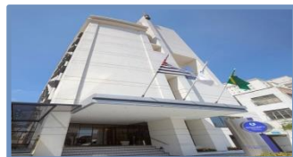
Transamérica Congonhas (São Paulo – SP)