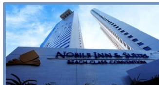
Beach Class Residence (Recife – PE)