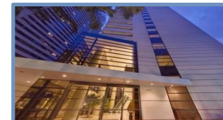
Grand Plaza São Paulo Jardins (São Paulo – SP)