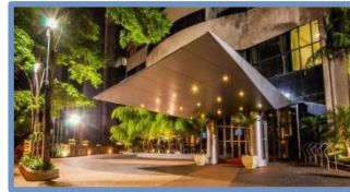
Prodigy Grand Hotel & Suites Berrini (São Paulo – SP)