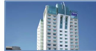
TRYP São Paulo Berrini (São Paulo – SP)