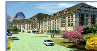
Bristol Vista Azul (Pedra Azul – ES)